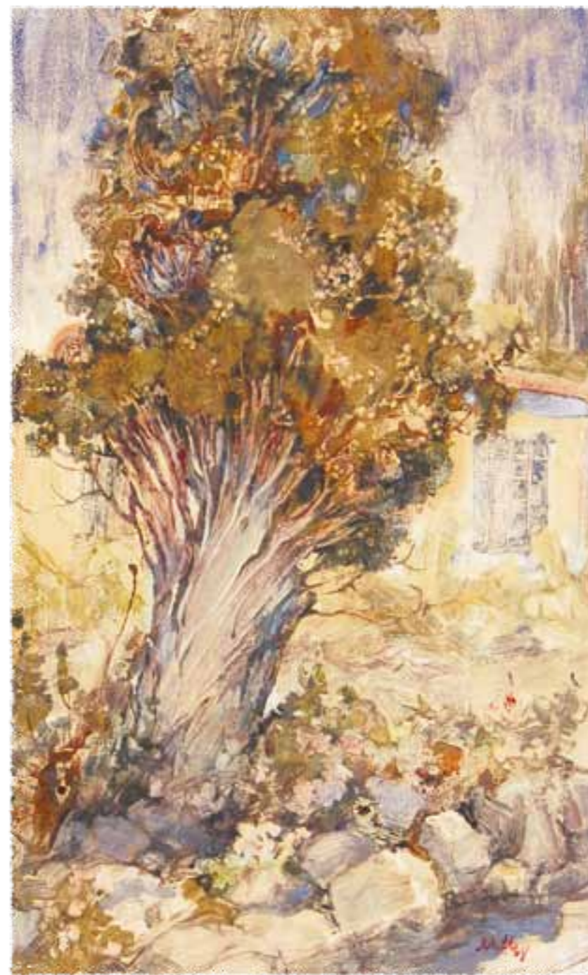
Мария Мыслина. Старое дерево. 1968

Каков же прогноз на будущее? «В конце XIX века парижан пугали тем, что темп роста парка конных экипажей вскоре превратит Париж